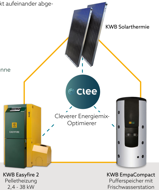
KWB Easyfire 2 Pelletheizung 2,4 - 38 kW