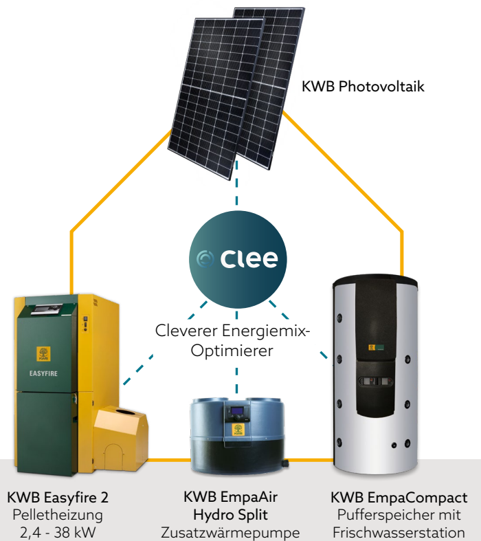
KWB Easyfire 2 Pelletheizung 2,4 - 38 kW