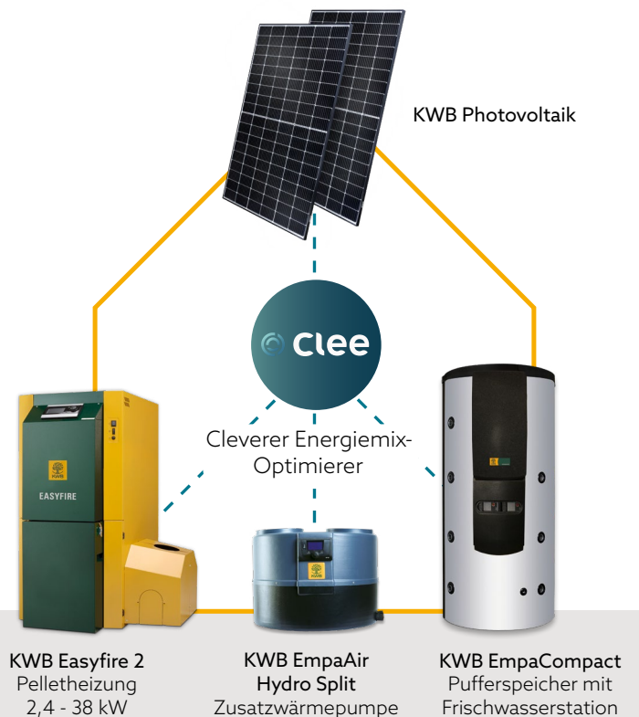
KWB Easyfire 2 Pelletheizung 2,4 - 38 kW